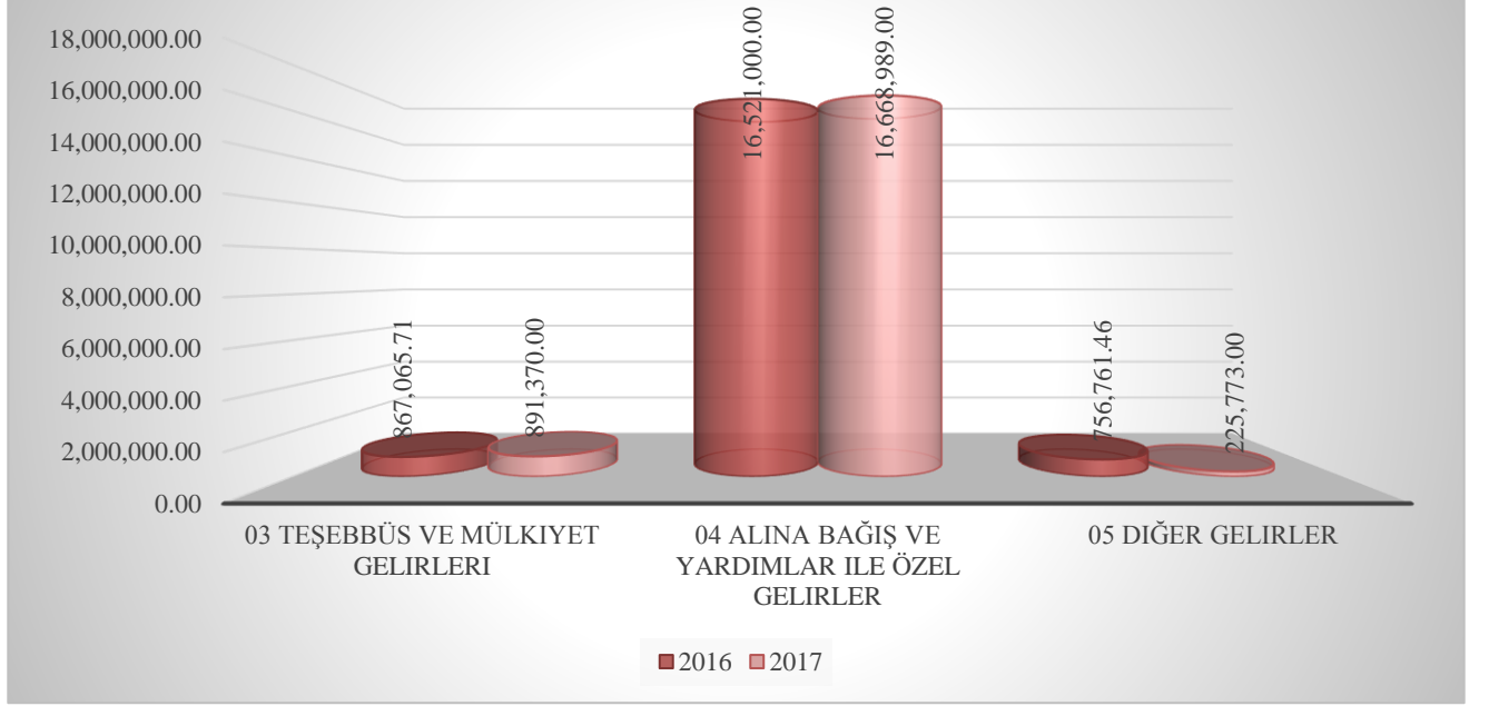
Grafik 3: I. Üç Aylık Bütçe Gelir Gerçekleşme Grafiği

Diğer Gelirler; 2017 yılı I. üç aylık döneminde 225.773 TL olarak gerçekleşen gelir tahsilatı 2017 yılı bütçemizde planlanan 1.711.000,00 TL ödeneğin % 13,20'si oranında gerçekleşmiştir.